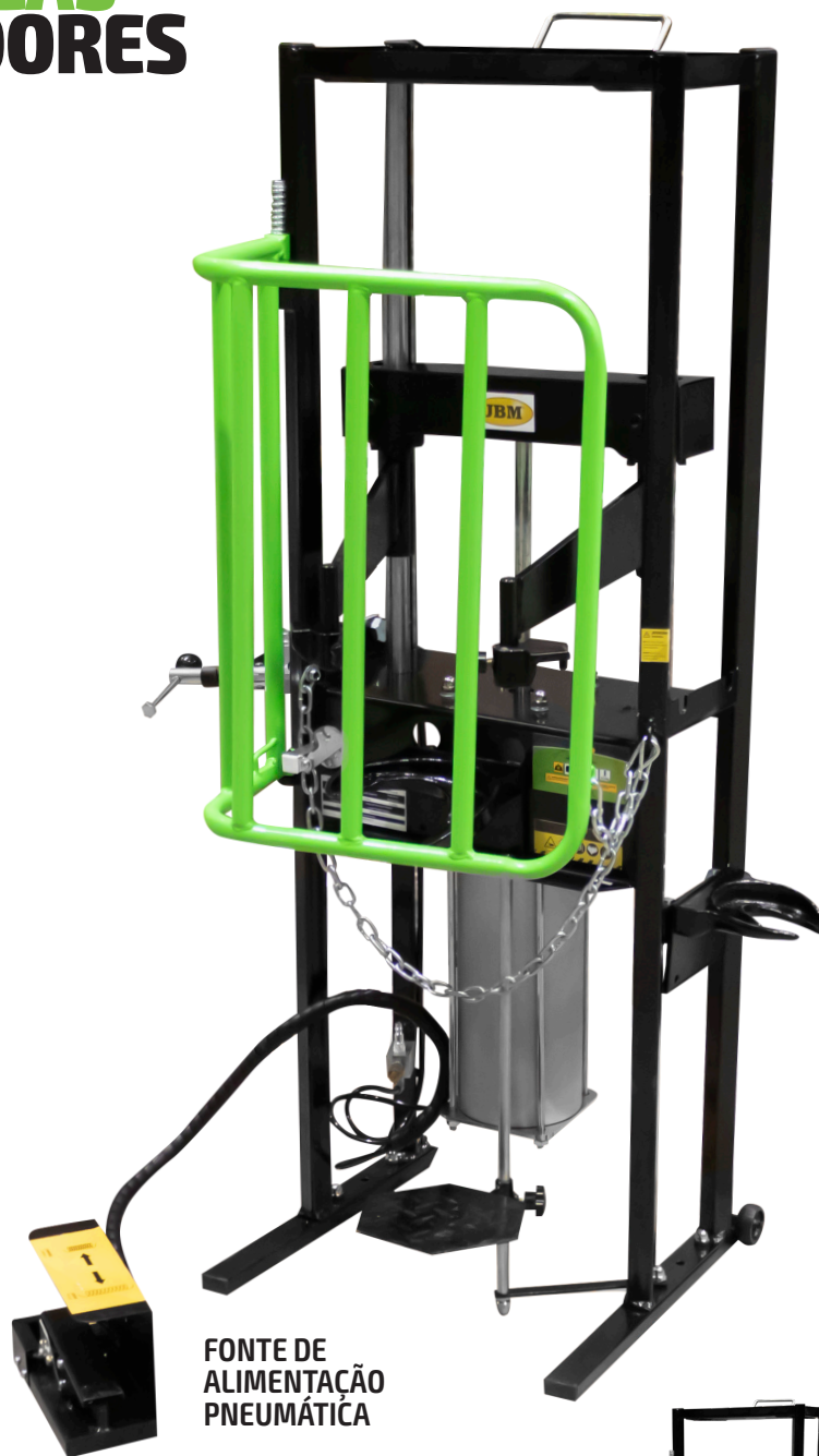
FONTE DE ALIMENTAÇÃO PNEUMÁTICA

✓ PEDAL DE PÉ PARA TRABALHAR DE LONGE DURANTE A OPERAÇÃO QUE PERMITE QUE O OPERADOR TRABALHE FORA DA ÁREA DE PERIGO